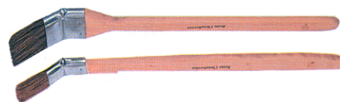
Fig. 48 Pincel ergonómicamente adecuado

Para acceder a alturas superiores al nivel del hombro del trabajador y evitar las inclinaciones de cuello descritas, se recomienda el uso de un "módulo con escalones". Para pintar las zonas superiores de las paredes y los techos se recomienda la utilización de rodillos con mango telescópico, de fácil regulación y que permita al Trabajador operar desde una posición más adecuada, sin necesidad de elevar los brazos excesivamente (Fig. 49).