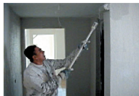
Fig. 47 Inclinación cuello

Durante el pintado de las paredes verticales el Trabajador se sitúa a nivel de suelo y debe inclinar continuamente el cuello hacia atrás para comprobar la correcta aplicación de la pintura en las zonas más altas (Fig. 47).